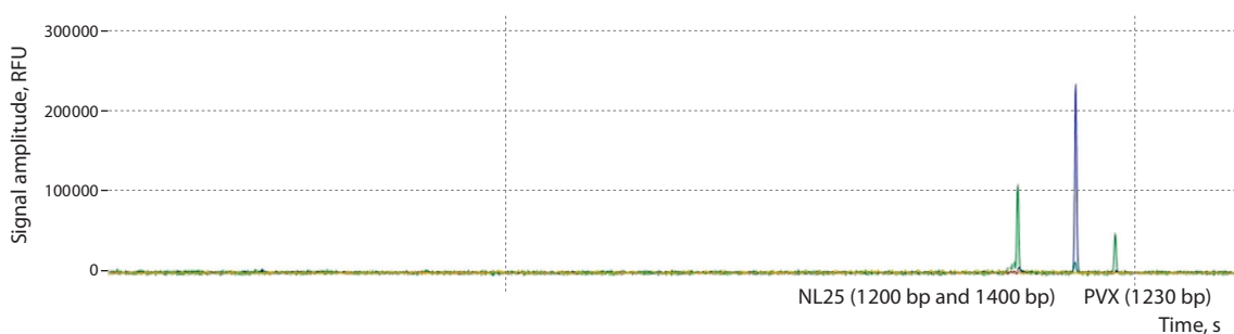
Fig. 2. Chromatographic resolution of two reactions: NL25 and PVX.

тол»). Капиллярный электрофорез имеет высокую разрешающую способность, что позволяет идентифицировать близкие по длине фрагменты, в том числе за счет использования различающихся по спектру флуорофоров. Полученные данные анализировали с использованием программы «ДНК Фрагментный анализ» (ИАП РАН).