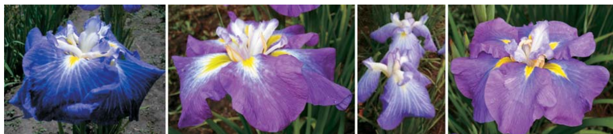
Рис. 2. Сорта Синильга, Горянинский, Павла, Верхне-Обский.