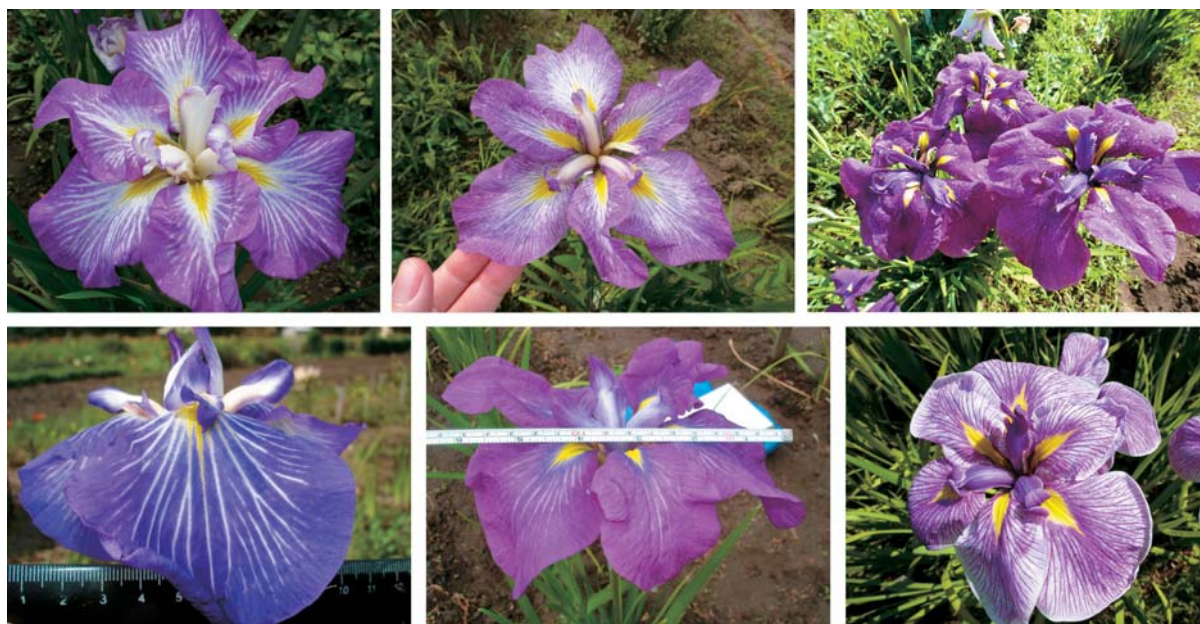
Рис. 6. Гибриды из спонтанного потомства отборного гибрида 9-175-97.

Самое раннее зацветание было у дикой формы: 1 июля, через 47 дней после отрастания. Ранние трехлепестные гибриды зацвели 8 июля, на 50–51-й день от фазы отрастания. В группе среднезацветающих (12 июля, через 56 дней от отрастания) – 22 сорта и гибрида. Самый ранний срок зацветания в группе был у сорта Цама-но-мори (9 июля, 52 дня от отрас-