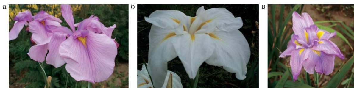
Рис. 7. а – ♀ Сиреневая Дымка; б – ♂ Алтайская Снегурочка; в – гибрид.