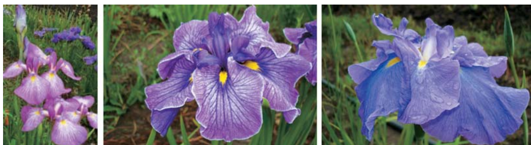
Рис. 1. Гибрид 9-175-97; сорт Jaretus; сорт Tender Trap.