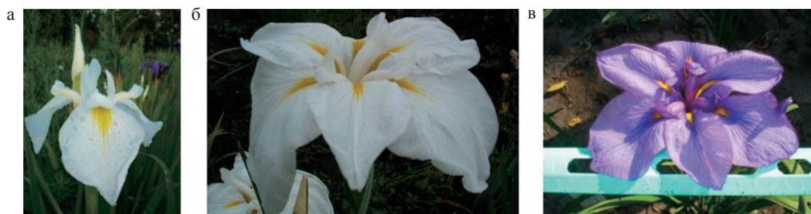
Рис. 8. а – ♀ Клавдия Попова; б – ♂ Алтайская Снегурочка; в – гибрид.