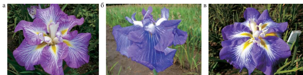
Рис. 3. а – ♀ Усть-Катунь; б – ♂ гибрид 1-55-09; в – гибрид.